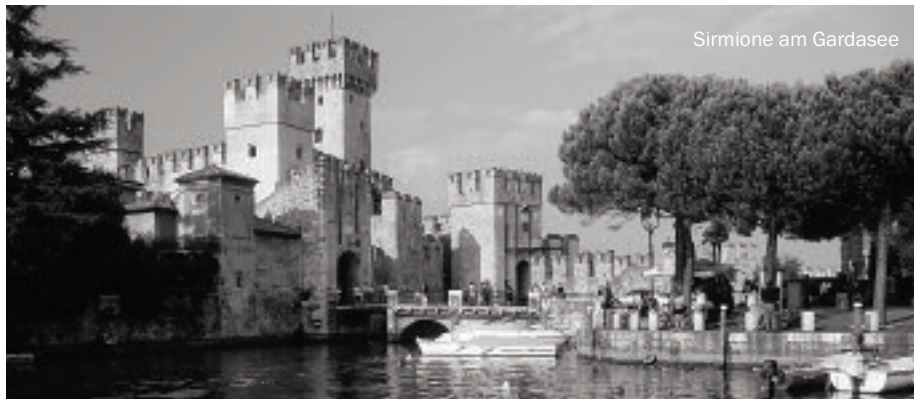
Sirmione am Gardasee