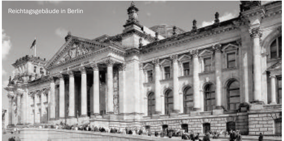
Reichtagsgebäude in Berlin

vhs, Burgstr. 21 / EUR 183,00 / 10 - 16 Teiln.