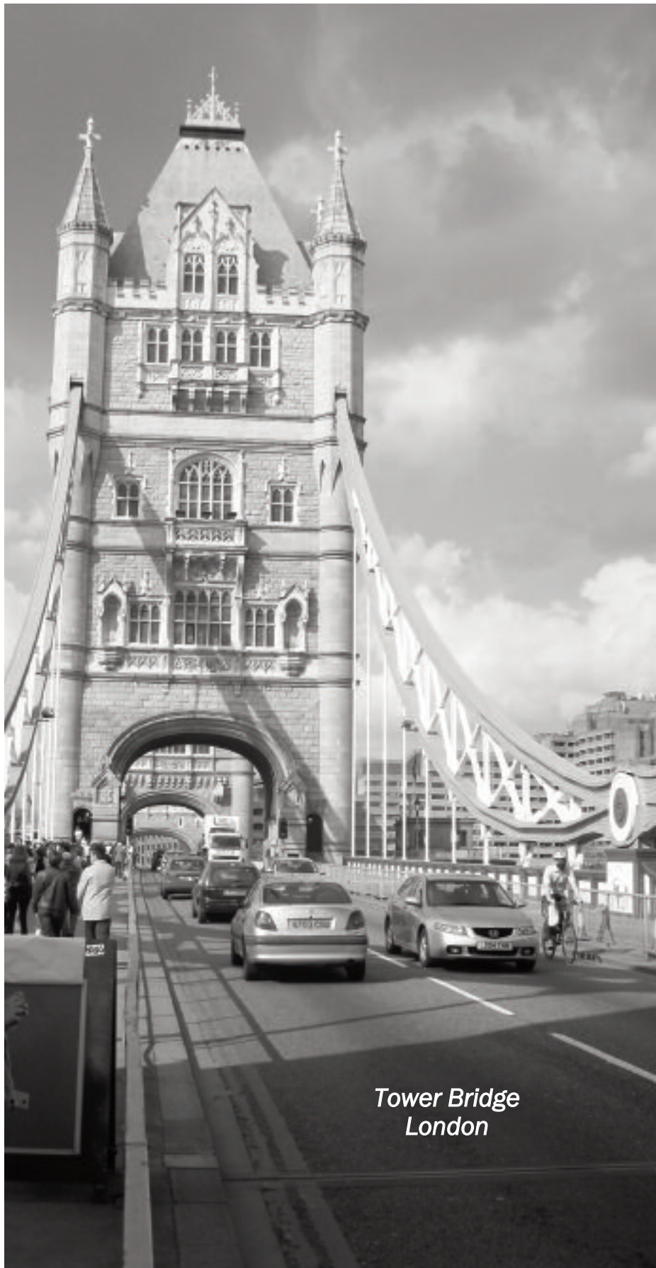
Tower Bridge London

Jeder kann Sprachen lernen - das ganze Leben lang, dafür gibt es kein zu jung oder zu alt!