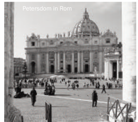
Petersdom in Rom

Samstag, 21.07.12, 09:00 - 12:00 Uhr Yasmin Lupo, Diplom-Übersetzerin vhs, Burgstr. 21 / EUR 18,00 / 6 - 9 Teiln.